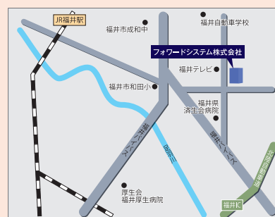
アクセス(福井本社)

■JR 「東京駅」日本橋口 徒歩0分 ■東京メトロ 東西線「大手町駅」B7出入口 直結